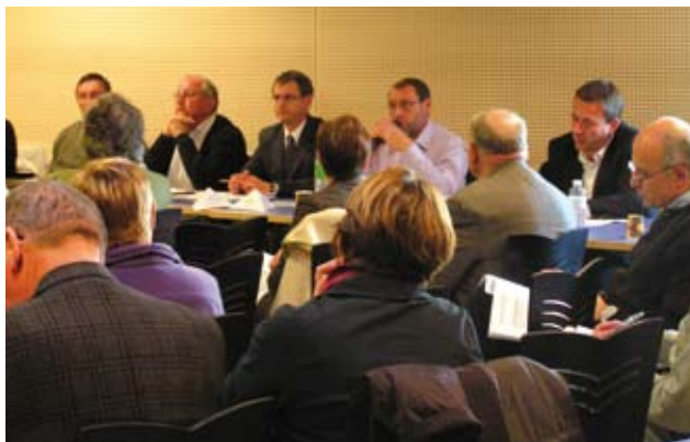
La démarche a été adoptée lors du Comité Syndical du 22 Octobre dernier

Valor'Aisne souhaite que ce projet soit le plus rassembleur possible, car nous sommes tous concernés par la gestion des déchets ménagers que nous produisons chaque jour.